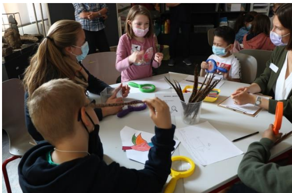
Bildunterschrift: Erst- und Zweitklässler der Bornheimer Verbundschule testen Workshop-Angebot des Forschungsbusses zum Thema Vögel.